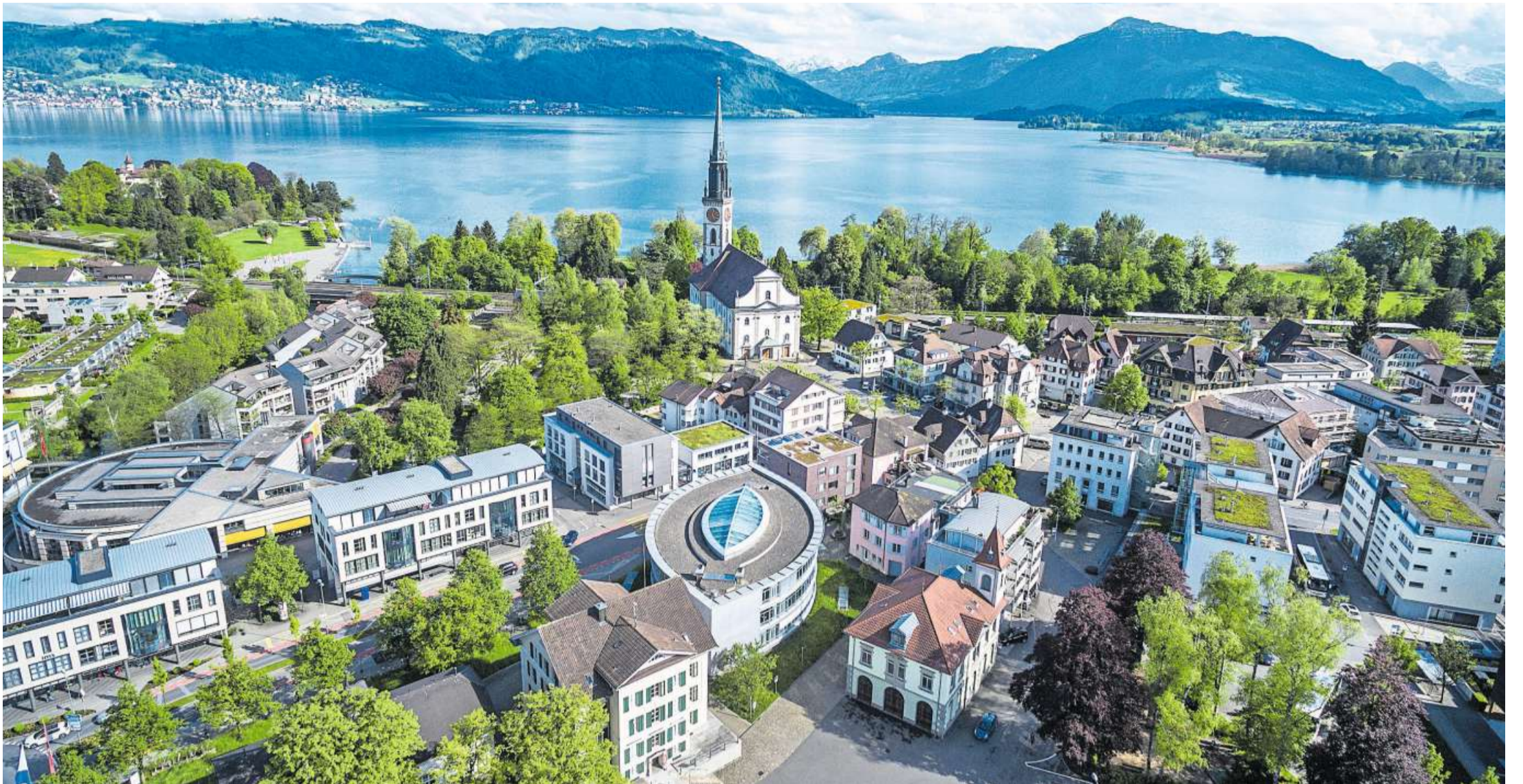
So mannigfaltig wie die Ennetseegeemeinde Cham mit ihren über 16 500 Einwohnerinnen und Einwohnern ist auch das Gewerbe. Der Gewerbeverein wurde vor 100 Jahren gegründet.