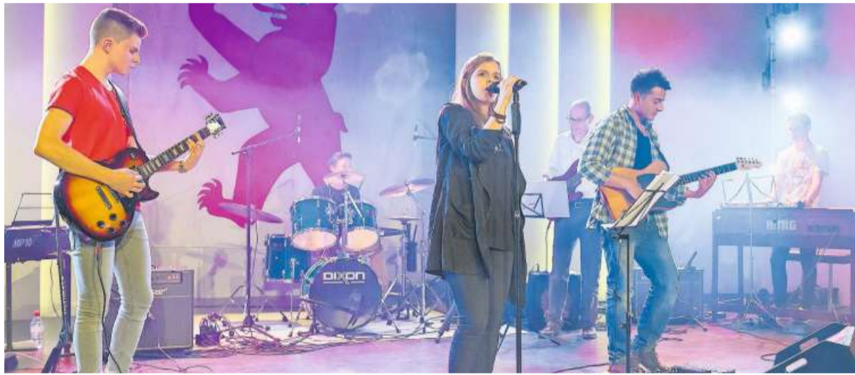
Sie sind die Lokalmatadore: die junge Chamer Band «That's it». Sie hat am Freitagabend um 22.30 Uhr ihren Auftritt.