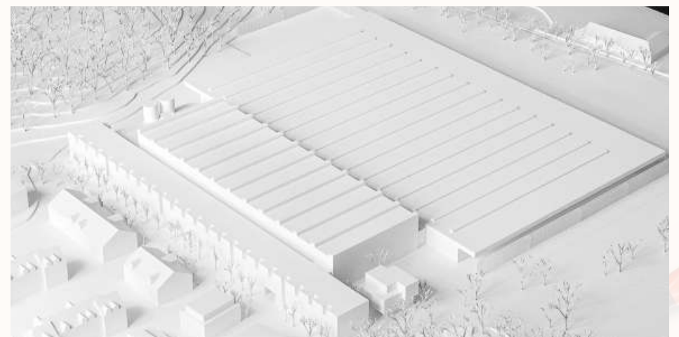
Das Modell des Innovationsprojekts «Gottfried Baumgartner» wird an der Choma ausgestellt.

An der Chamer Gewerbeausstellung Choma, die zwischen dem 12. und 14. April im Hirsgarten in Cham durchgeführt wird, präsentiert die Fensterfabrikation Baumgartner auch das Innovationsprojekt «Gottfried Baumgartner».