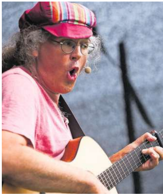
Der Kinderliedermacher Linard Bardill steht am Samstag um 13 Uhr auf der Bühne im Festzelt.

Auf dem Aussengelände wird zudem den Kindern einiges geboten. Sie können sich in der Hüpfburg austoben oder allerlei Tiere im Streichelzoo kennenlernen. Am Samstag findet zudem ein Zirkusworkshop statt. Im Kinderparadies wird den Sprösslingen im Alter von 3 bis 8 Jahren sicher auch nicht langweilig. ar