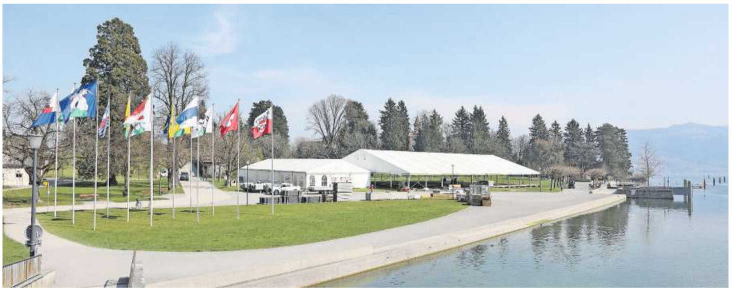
Die Choma findet dieses Jahr im Hirsgarten statt. Für die Ausstellung wurden extra Zelte aufgebaut.

«Als Verein ein ganzes Jahrhundert zu feiern, ist schon etwas ganz Besonderes. Denn in der heutigen Zeit sind 100 Jahre Wirtschaftsgeschichte, in der das Gewerbe eine zentrale Rolle spielt, eine halbe Ewig-