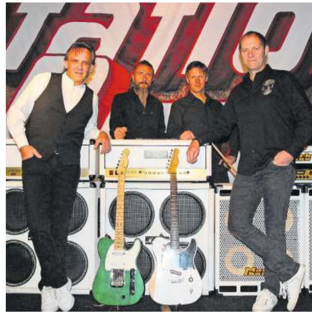
Mit der Tribute-Band Station Quo steigt am Samstagabend ab 22.30 Uhr die Party.